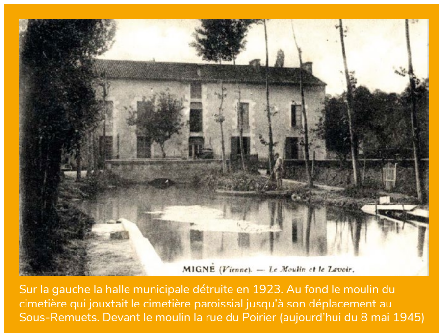
Sur la gauche la halle municipale détruite en 1923. Au fond le moulin du cimetière qui jouxtait le cimetière paroissial jusqu'à son déplacement au Sous-Remuets. Devant le moulin la rue du Poirier (aujourd'hui du 8 mai 1945)